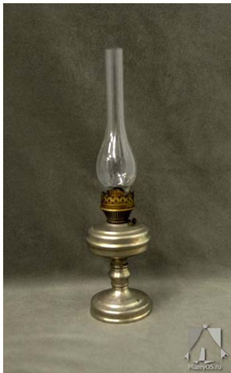
Керосиновая лампа "Красный факел", СССР, Самара, Государственная фабрика № 5 Металштамп, 1928 - 1935 г.г.